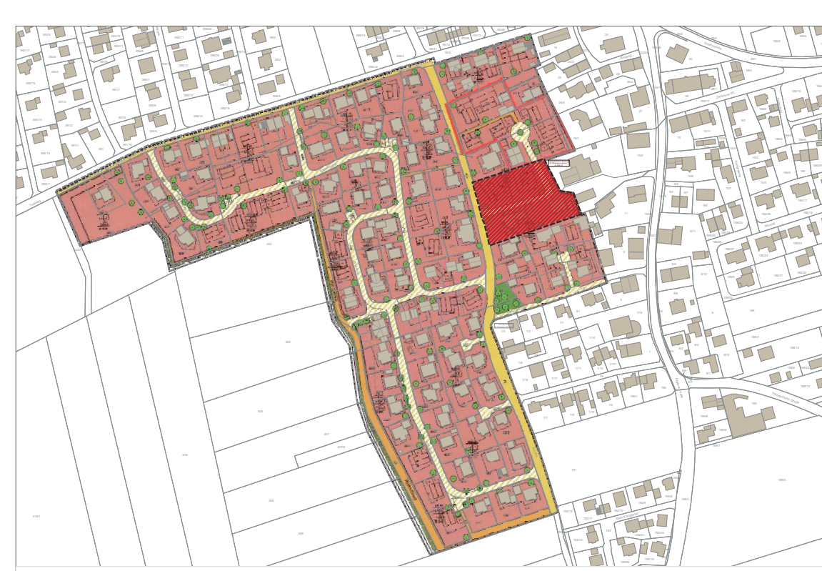
Übersichtslageplan M 1:5.000